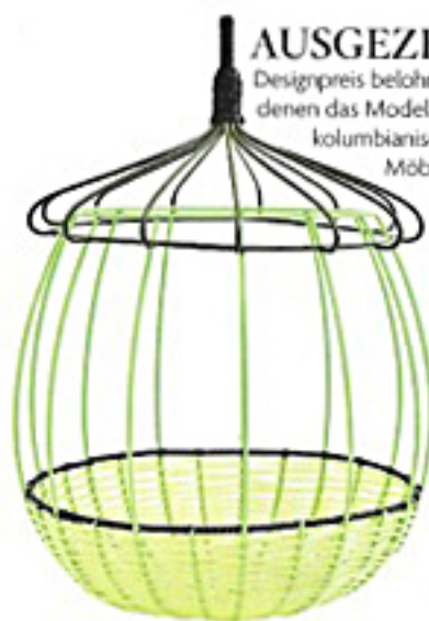
AUSGEZEICHNET Mit einem Designpreis belohnt: die Gefäße und Skulpturen, mit denen das Modelabel Marni seine von einem kolumbianischen Frauenkollektiv produzierte Möbelreihe erweitert. Korb 300 €.

MUST-SEE IN NEW YORK: DIE AUSSTELLUNG „PATH-MAKERS – WOMEN IN ARTS, CRAFT AND DESIGN“. MADMUSEUM.ORG, BIS 30.9.