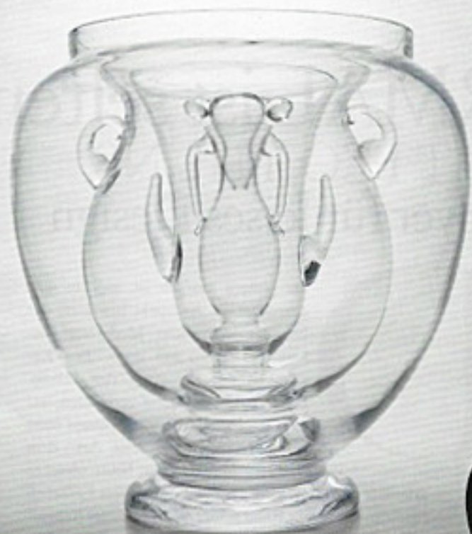
ALL-IN-ONE „The Archetypal Vase“ lässt die Evolution klassischer Formen sichtbar werden. Mundgeblasenes Glas, Ø 35, H 35 cm. Limitierte Edition von zwölf Exemplaren. Von Andrea Bandoni und Joana Merz.