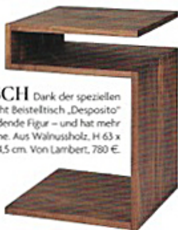
S-TISCH Dank der speziellen Form macht Beistelltisch „Desposito“ eine blendende Figur – und hat mehr Ablagefläche. Aus Walnussholz, H 63 x B 44,5 x T 44,5 cm. Von Lambert, 780 €.

MUST-SEE IN NEW YORK: DIE AUSSTELLUNG „PATH-MAKERS – WOMEN IN ARTS, CRAFT AND DESIGN“. MADMUSEUM.ORG, BIS 30.9.